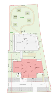
PLAN MASSE DE REPERAGE