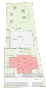
PLAN MASSE DE REPERAGE