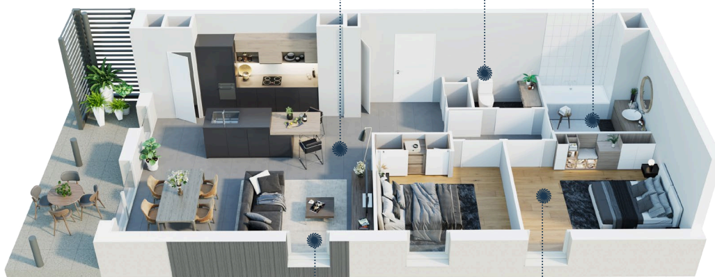
Exemple : T3 - Bat C