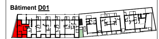
Plan masse de repérage